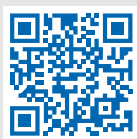
Сервис «Личный кабинет»

Электронный сервис ФНС России «Личный кабинет налогоплательщика для физических лиц» позволяет не выходя из дома: